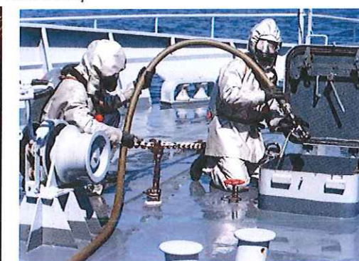
Pompier de la flotte QMF MOPOMPI