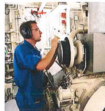
Mécanicien naval : EDM MECAN / QMF MACHINE

Venez y rencontrer un conseiller du CIRFA Marine ORLEANS, les professeurs et visiter les installations du lycée Maréchal Leclerc (Internat, ateliers...)