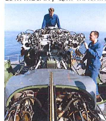
Mécanicien aéronautique : EDM PORTEUR / QMF MAINTAERO