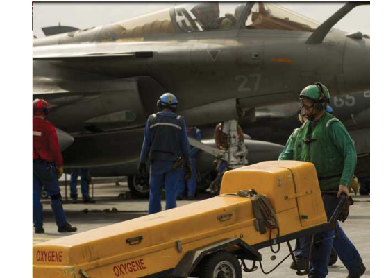
Matelot de piste et pont d'envol

Préservez l'environnement : n'imprimez ce courriel qu'en cas de nécessité.