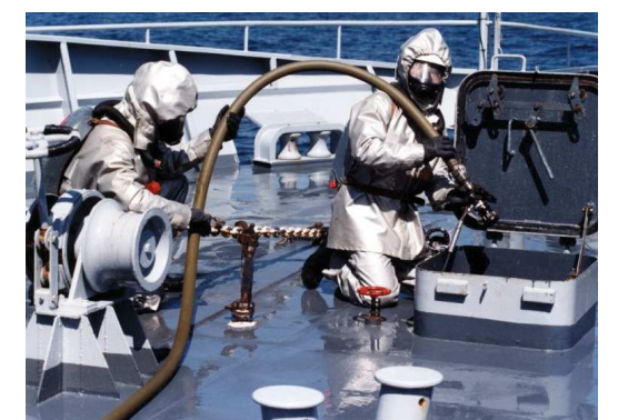
Pompier de la flotte