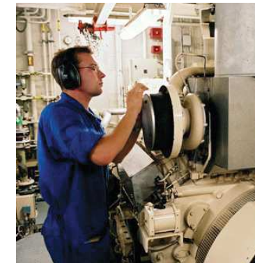
Mécanicien naval :

Après délibération, le jury prononcera l'admission, le placement en liste complémentaire ou le refus de la candidature. Les candidats en seront informés par courrier.