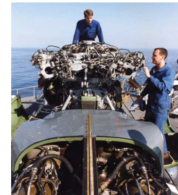
Mécanicien aéronautique :